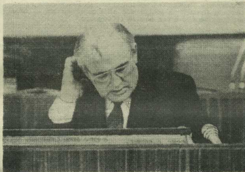
Есть о чем задуматься, Президент?

Хотелось бы также заметить, что слово «евреи» во множественном числе должно звучать — «иди», жаргонное же «айды» — свидетельство элементарной языковой неграмотности.